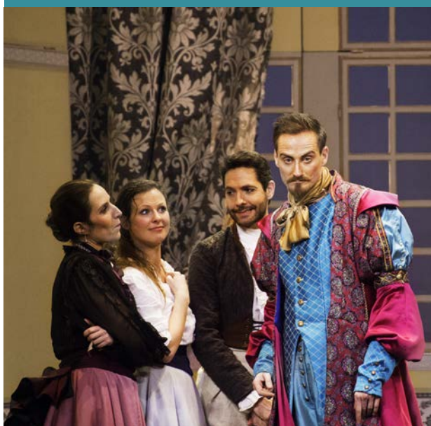
LE MARIAGE DE FIGARO